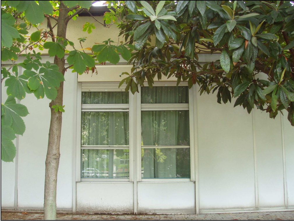
Foto 3 : Esempio di tipologia di infisso da sostituire - Prospetto Sud